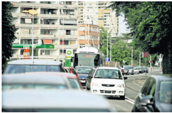
La fermeture d'un chemin a diminué le passage de véhicules de 600 par jour à moins de 100. Un élu critique cette «privatisation».

La maire, Carole-Anne Kast, conteste cette vision: «Ce chemin n'est pas devenu privé, mais offre effectivement moins d'intérêt. On lui a simplement rendu sa desti-