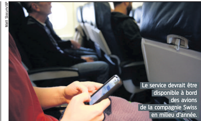
Le service devrait être disponible à bord des avions de la compagnie Swiss en milieu d'année.