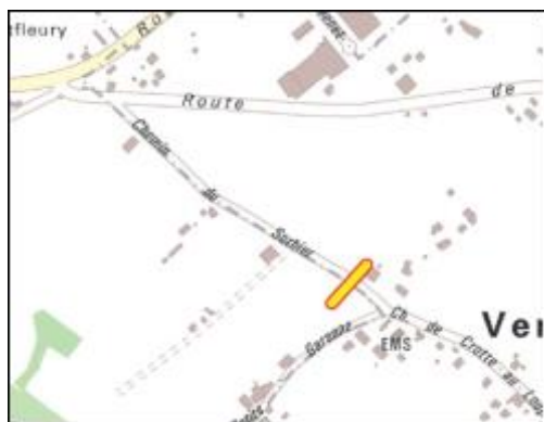
Localisation du comptage

Par ailleurs, pour rappel, une campagne de comptage avait également été lancée sur le chemin de Mouille-Galand avant sa mise en impasse (juin 2012 – 3000 véhic/j dénombrés).