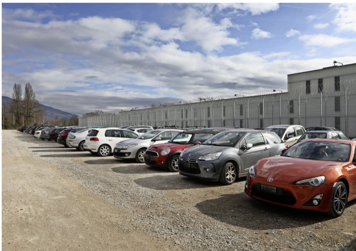
La Brenaz et son parking de 325 places. Or, une partie du terrain se trouve en zone agricole ou en forêt, des secteurs censés être intouchables.