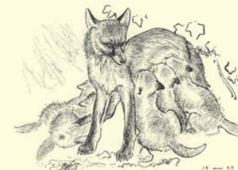
"Renarde avec ses petits" - Gravure de Robert Hainard.

Bien que fortement transformé par les activités humaines, le Rhône demeure un corridor biologique essentiel pour de nombreuses espèces telles que les grands mammifères, qui n'hésitent pas à le franchir. Ses rives boisées rayonnent en un réseau de vallons creusés par des nants et des rivières qui offrent des refuges bienvenus à la faune sauvage, pour autant que l'homme respecte leur besoin de tranquillité.