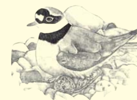
"Petit gravelot au nid" - Gravure de Robert Hainard.

Le Rhône occupe son lit actuel depuis 1940. Auparavant, le fleuve décrivait un méandre au pied des falaises : la "Boucle de Cartigny". La correction du fleuve répondait au projet d'aménagement de l'usine hydroélectrique à Verbois qui nécessitait un cours plus direct pour l'écoulement des eaux. Depuis, la "Boucle" est devenue un bras mort alimenté par des sources, des nappes souterraines et en sa partie inférieure, par le fleuve lui-même.