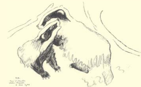
"Tour St Martin Chêne-Paquier" - Gravure de Robert Hainard.

Par endroits, les moraines affleurent et les blaireaux qui les affectionnent tout particulièrement y ont creusé de complexes galeries. La visite d'un terrier par un chien peut provoquer l'exode de toute une famille. S'il vous plaît, veuillez respecter les consignes en tenant votre compagnon en laisse !