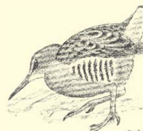
"Rôle d'eau" - Gravure de Robert Hainard.

Face au projet de correction du Rhône à la fin des années trente, les milieux genevois de protection de la nature s'opposèrent au remblayage de l'ancien lit. Par la suite, malgré la volonté politique de conserver les plans d'eau du Moulin-de-Vert, ceux-ci se sont comblés progressivement, privés de la dynamique régénératrice du fleuve. Le processus naturel d'atterrissement a été accéléré par l'érosion de la falaise de Cartigny qui, sous l'effet du ruissellement, du gel et du dégel, alimente constamment l'ancien lit en matériaux.