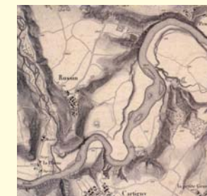
Carte Dufour de 1837.

Quand le Rhône coulait libre, le courant venait se calmer entre les roseaux et les bancs de sable. Là où la végétation avait été emportée par les dernières crues, le fleuve s'étalait sur des plages de graviers où venaient se reposer les oiseaux migrateurs. Les berges d'alors offraient de nombreux habitats à la faune. Le tracé rectiligne d'aujourd'hui a nécessité la stabilisation des berges à l'aide d'enrochements et le fleuve ainsi corseté a perdu une bonne part de son attrait.