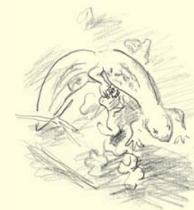
"Triton nageant entre deux eaux" - Gravure de Robert Hainard.

Les nombreuses sources ruisselant des forêts de pentes viennent alimenter des petites mares forestières au pied de la falaise de Cartigny. La plupart s'assèchent en été, laissant toutefois le temps nécessaire aux larves des amphibiens de se développer. Ces zones humides temporaires sont fréquentées par des espèces sensibles qui ne tolèrent pas la concurrence des poissons dans les étangs. La végétation abondante de ces petits plans d'eau favorise nos espèces locales de tritons (triton alpestre et triton palmé). Dans les plans d'eau de taille plus importante et moins végétalisés, celles-ci entrent fréquemment en compétition avec une sous-espèce méridionale du triton crêté et la grenouille rieuse introduites par l'homme.